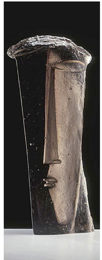
Stanislav Libenský and Jaroslava Brychtová: „Head I“, 1958–1959, mould-melted, acid-etched, cut glass, h. 36 cm